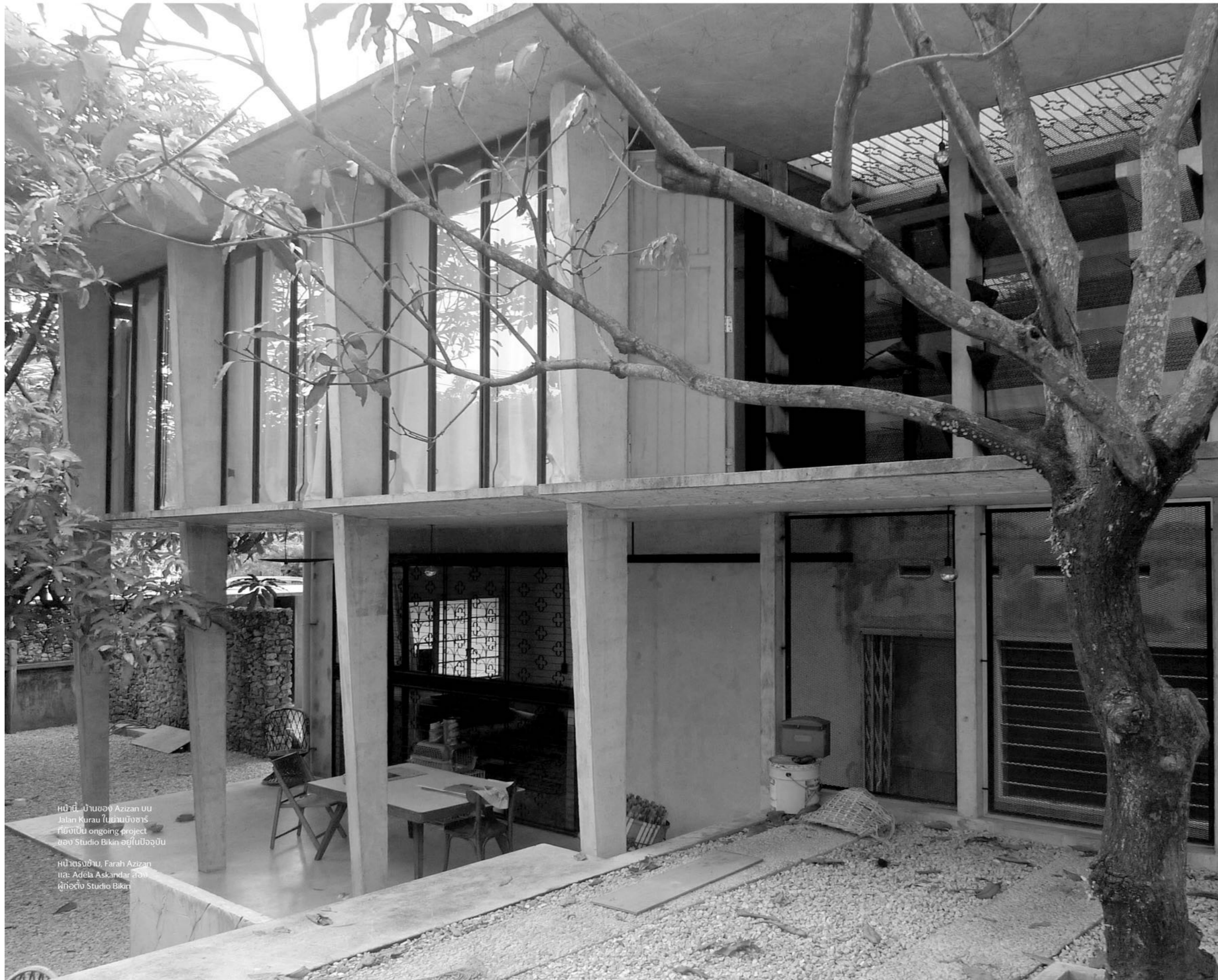
หน้านี้: บ้านของ Azizan บบ Jalan Kurau ในย่านบึงฮาริส ที่ยังเป็น ongoing project ของ Studio Bikin อยู่ในปัจจุบัน